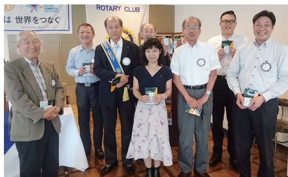
メイクアップ 100%皆出席のみなさま