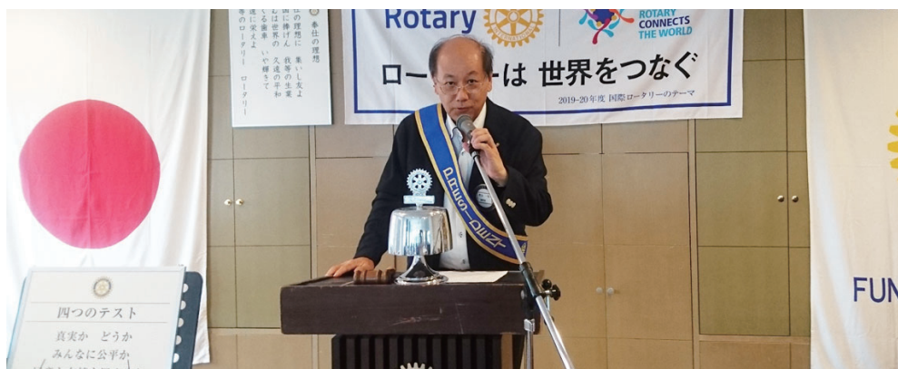
今年度会長 度会会長あいさつ