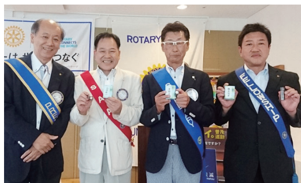
ホームクラブ 100%皆出席のみなさま