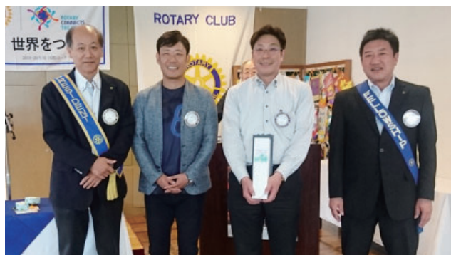
三つのお祝い 会員誕生日 おめでとうございます。